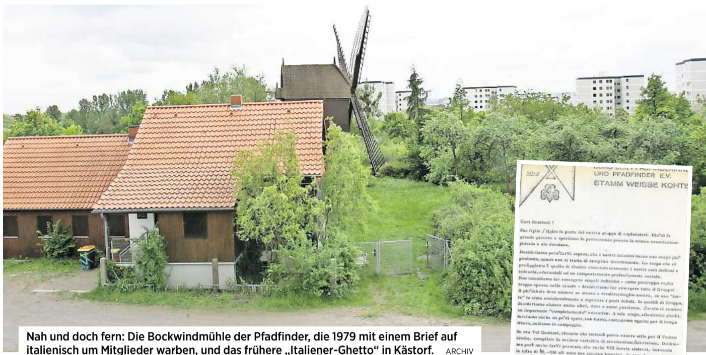
Nah und doch fern: Die Bockwindmühle der Pfadfinder, die 1979 mit einem Brief auf italienisch um Mitglieder warben, und das frühere „Italiener-Ghetto“ in Kästorf.