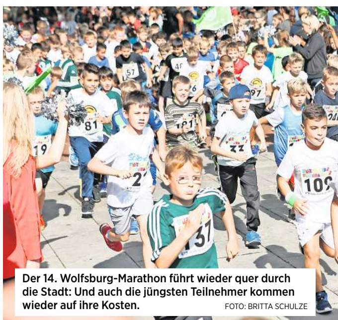
Der 14. Wolfsburg-Marathon führt wieder quer durch die Stadt: Und auch die jüngsten Teilnehmer kommen wieder auf ihre Kosten.

Online-Anmeldung gestartet – Angebot für Kinder der Jahrgänge 2007 bis 2014