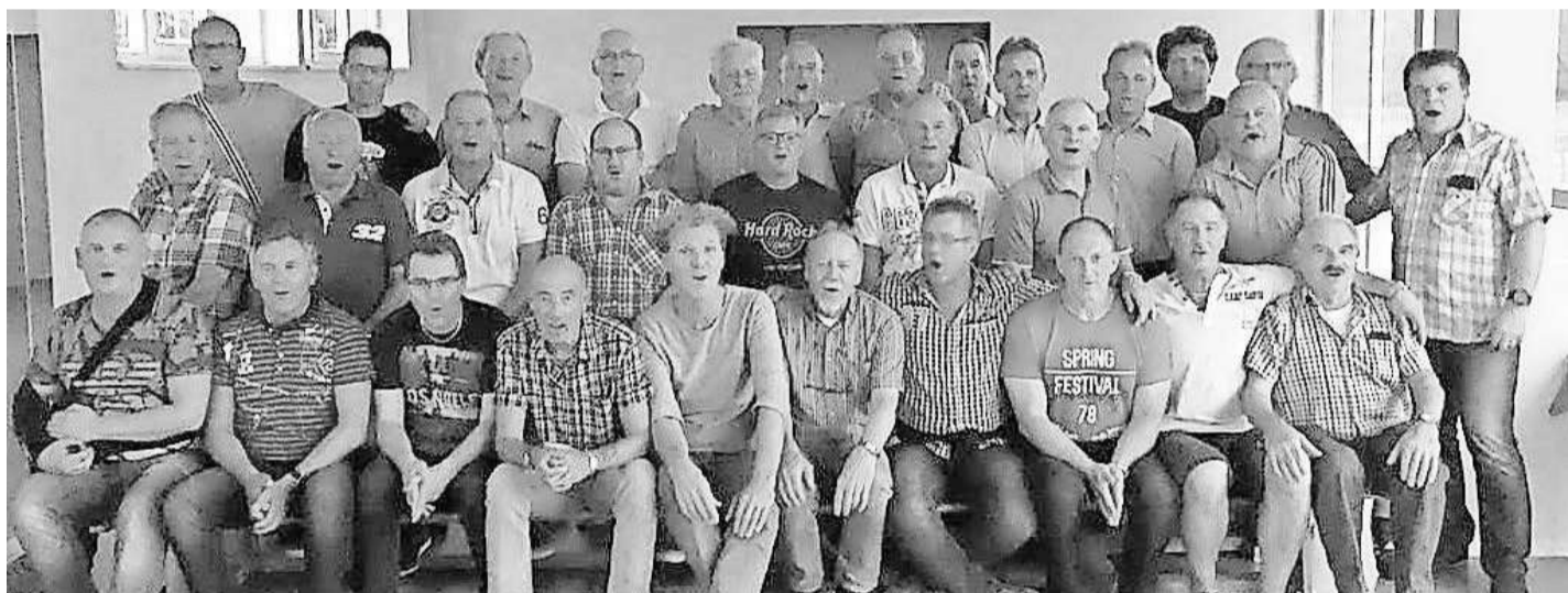
Wiedersehen im Vereinsheim: Die Fußballer der zweiten und dritten Herrenmannschaften von 1975 bis 1990 kamen jetzt zum Ehemaligentreffen zusammen.