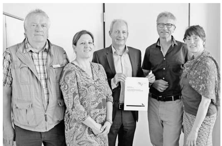
Kooperation: Jobcenter und Sozialpsychiatrischer Dienst akquirieren Stellen für Menschen mit seelischen Krankheiten.

aber aktuell nicht auf dem ersten Arbeitsmarkt vermittelbar sind. Dank einer Spende der Margarete-Schnellecke-Stiftung, können nun auch Rentner dieses Angebot nutzen. Zuverdienst bedeutet, ein gemeindenahes und niedrigschwelliges Beschäftigungsangebot, das auch Menschen mit schwerer Beeinträchtigung ermöglichen soll, ihre Arbeitsfähigkeit zu erproben.