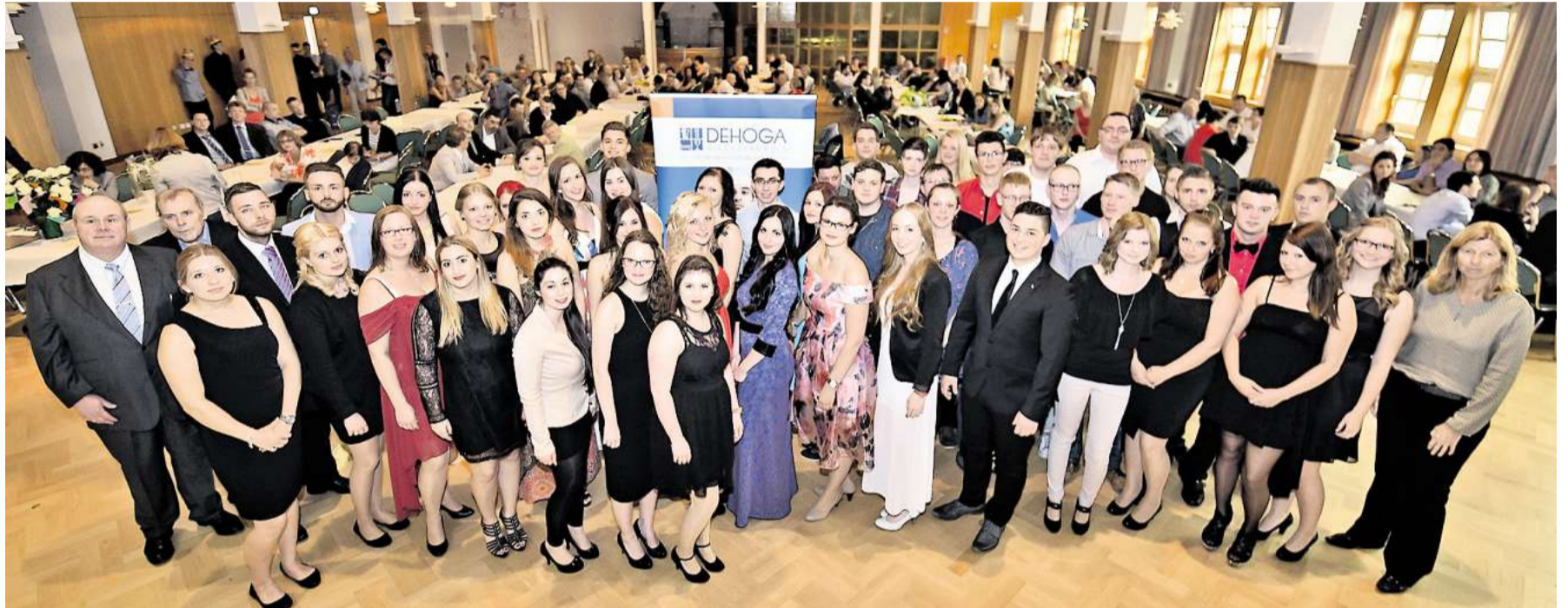
51 erfolgreiche Prüflinge: Das Gastgewerbe und die BBS I aus Gifhorn hatten zur Freisprechungsfeier eingeladen.